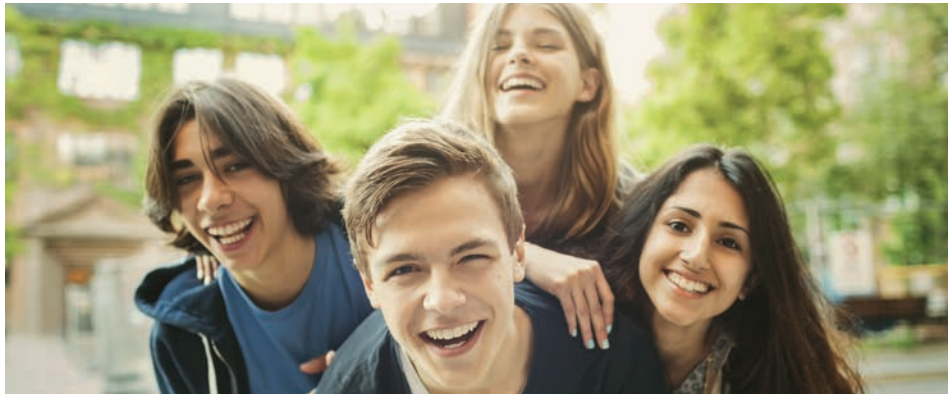
Die Schulfamilie der Realschule Neubiberg

Unsere und Ihre Kinder werden es Ihnen danken!