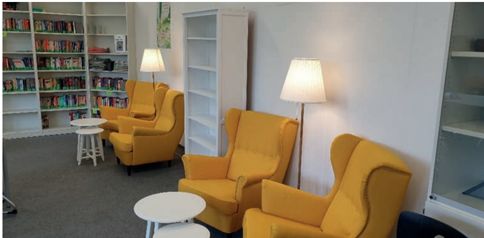
Neugestaltung der Bibliothek 2020

Wir fördern jede Fachschaft und Ausbildungsrichtung. Dadurch wollen wir unseren Schüler*innen besondere Erlebnisse und Erfahrungen durch die Durchführung kultureller, sportlicher, musischer und technischer Projekte sowie Aktivitäten vermitteln. Der Förderverein unterstützt diese Projekte finanziell, damit die Schule sie bei knappen Geldmitteln realisieren kann.